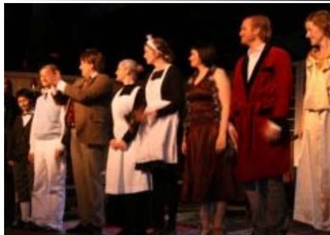
Stor fagnad for Spellaget på premieren.

Spellaget si oppsetjing av stykket til Knut Nærum vart ein ubetinga suksess. Dei fekk fleire publikummarar og meir førehandsomtale enn nokon gong før, men viktigast er teaterlaget si utvikling frå "ganske gode" til nesten proffe.