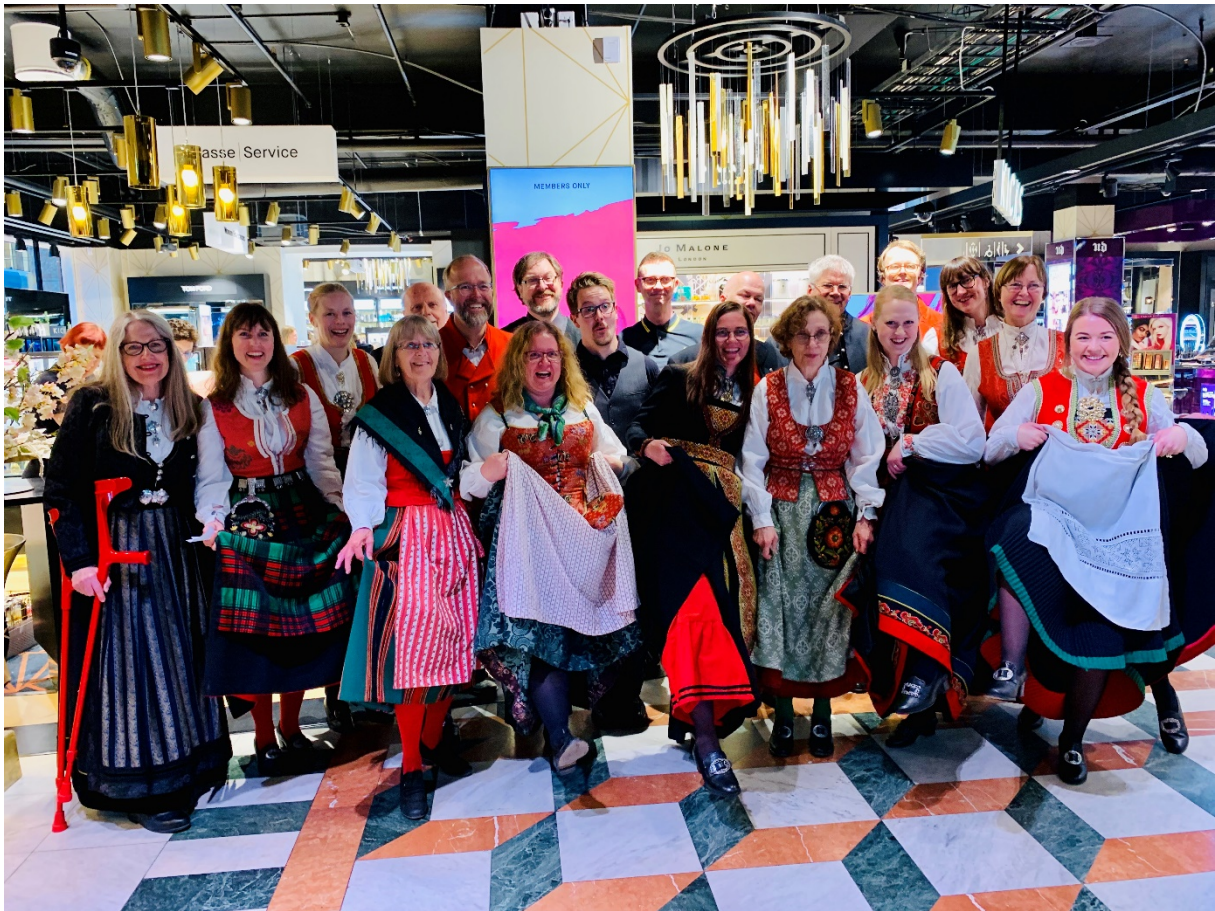
«Gærne jinter» på songoppdrag på Heimen Glasmagasinet