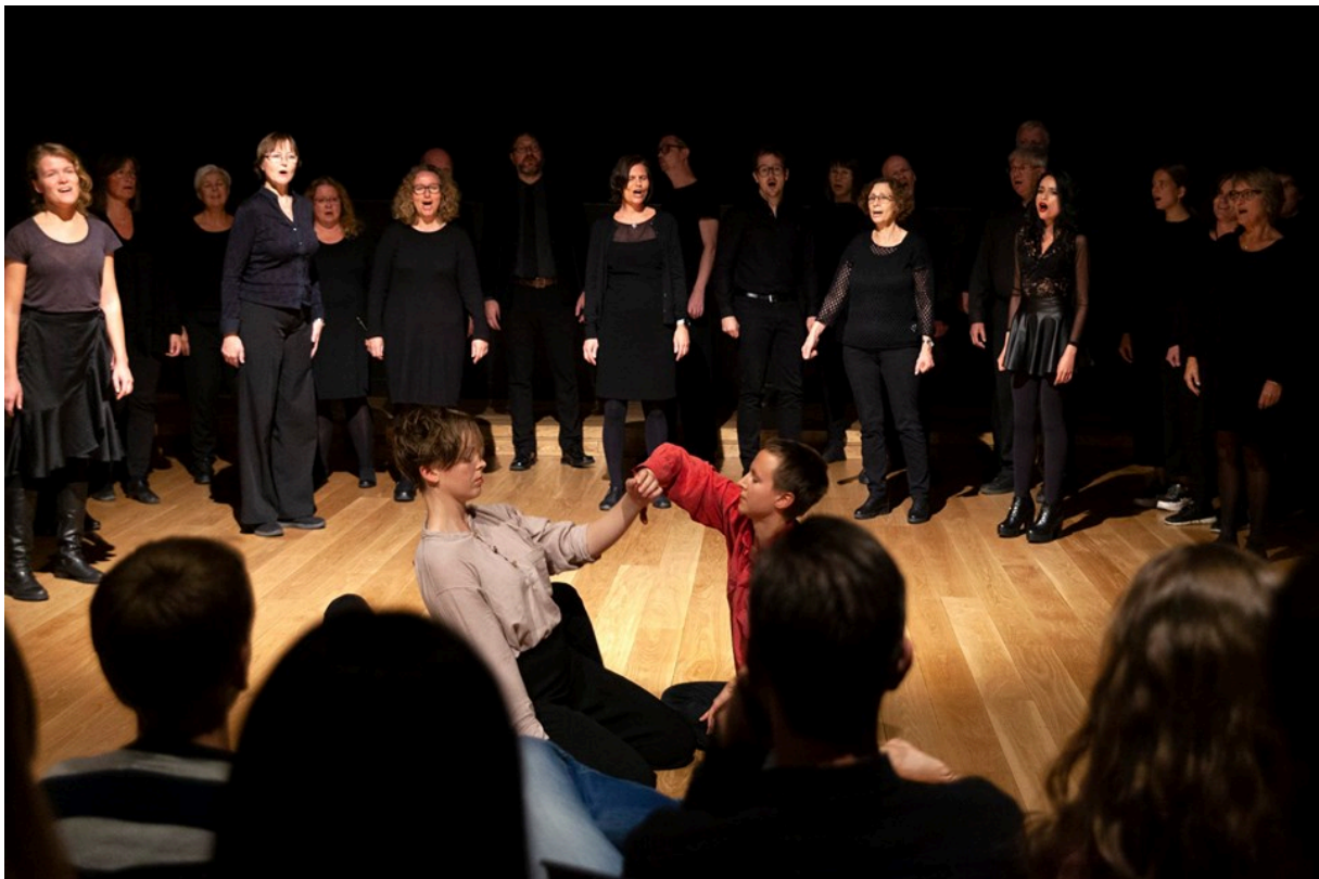
Songlaget syng Auge i vind, og dansarar frå Den Mangfaldige Scenen dansar.