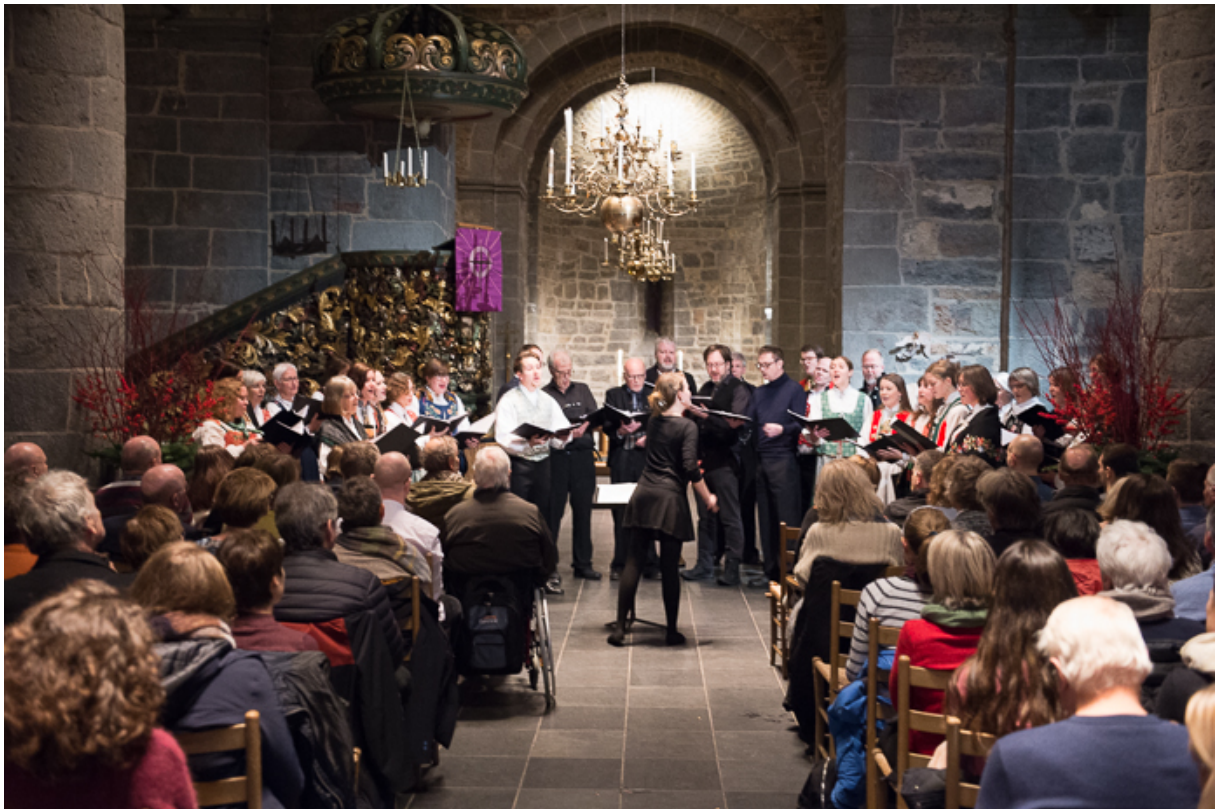
Songlaget – jolekonserten 2019