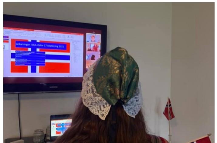
Leikarringen skipa til digital quiz på 17. mai

Leigetakarar som skal halde framsyningar i Nynorskens hus, har i 2021 fått tilbod om omtale av arrangementet sitt på facebookside Nynorskens hus, og i tillegg om å setje opp eit enkelt billettsal gjennom nettløysinga TicketCo. Nettsida Nynorskens hus, der vi elles legg ut informasjon om alle arrangementa i Teatersalen, blir ikkje oppdatert som følgje av bemanningssituasjonen på kontoret.