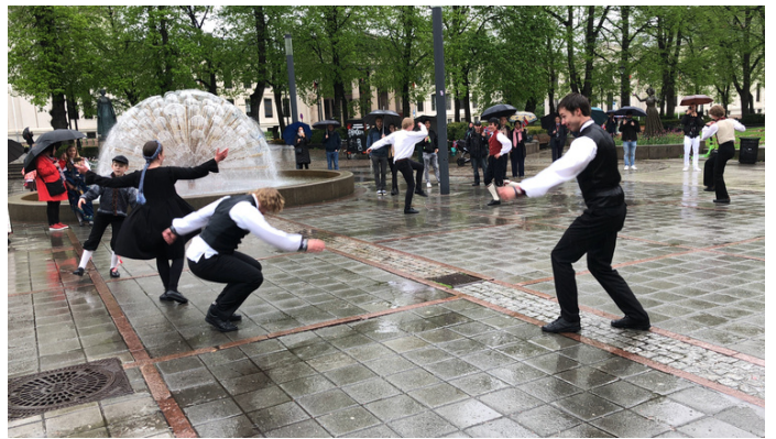
BULder dansa i gatene på 17. mai.

Gjennom sommaren var aktivitetsnivået lågt, og det vart inga deltaking på Landskappleiken, slik som tidlegare år. Derimot vart det stor stas på hausten, med lagdans på Oslokappleiken og ei jubileumsmarkering for NU, som fylte 125 i 2021, 2. november. Ved utgangen av 2021 hadde Leikarringen 126 medlemmer.