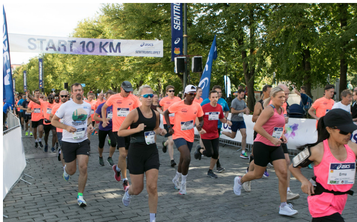
Sentrumsløpet 28. august 2021.

Ved utgangen av 2021 hadde IL 451 medlemmer – ein auke frå utgangen av 2020. Ein av grunnane til auken er at laget, ved hjelp av appen Gnist, har følgd tettare med på forfall og slik kunna tilby plass raskare til barn på venteliste.