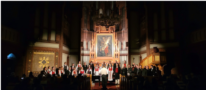
Frå julekonsert med Songlaget i Sagene kyrkje 11. desember.

Restriksjonane som følgde av koronapandemien har prega Songlaget gjennom 2021, men laget fekk likevel gjennomført to konsertar. Vårsemesteret vart mest krevjande når det gjeld øvingar. I det store og heile var det ikkje opna for innandørs aktivitet. Øvingar vart gjennomførte på Teams eller ute. Semesteret vart avslutta med sommarkonsert ute på Nedre Blindern gard. Hausten vart meir normal, med øvingar innandørs. Songlaget fekk så vidt gjennomført julekonsert før nye restriksjonar kom, rett nok med avgrensa publikumstal. Songlaget er godt nøgde med rekutteringa i 2021, særleg når det gjeld mannsstemmer.