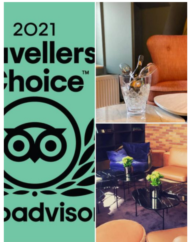
Hotell Bondeheimen fekk tittelen "Travellers Choice" frå den amerikanske reiseanmeldarsida Tripadvisor i 2021.

Etter eit til tider svært vanskeleg 2020 har 2021 vore eit noko betre år for forretningane. Men også dette året byrja i motbakke, med mange restriksjonar, som særleg prega hotellet og Kaffistova. Utover året gjekk det langt betre. Både gjennom sommaren og utover hausten, då vi ein lang periode ikkje hadde restriksjonar, gjekk Hotell Bondeheimen svært godt, med mange gjester frå både inn- og utland. Også Husfliden, særleg avdelinga i Rosenkrantz' gate, og Kaffistova har hatt god inntening store delar av året. Midt i desember kom restriksjonane tilbake, og det bidrog til ei litt tøff avslutning på 2021. Dei kom likevel såpass seint at det ikkje hadde den heilt store påverknaden på hotellet og Kaffistova i førjulsdagane, sidan begge uansett skulle halde stengt gjennom romjula.