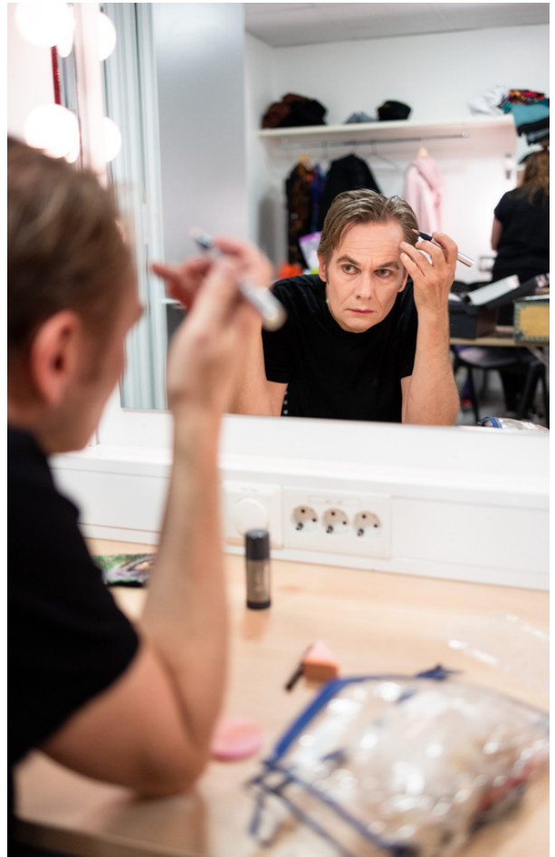
Frå sminkerommet under arbeidet med "Blood on Ice".

Teaterlaget har hatt ein del digitale leseprøver gjennom året, i dei periodane det ikkje har vore tillate å møtast fysisk. Laget arrangerte òg internvisning i desember. Medlemstalet i Teaterlaget held seg stabilt, med 21 betalende medlemmer i 2021.