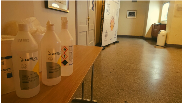
Også i 2021 har vi måtta ha tiltak for godt smittevern.

Dei fleste leigetakarane i Teatersalen har vore der før, men vi får også ein del førespurnader frå nye.