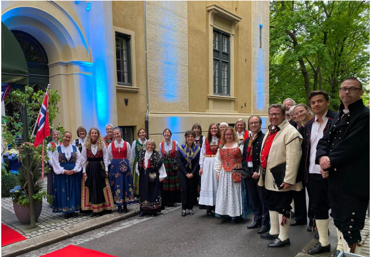
Song for cruiseturistar i Gamle Logen 18. mai 2022.