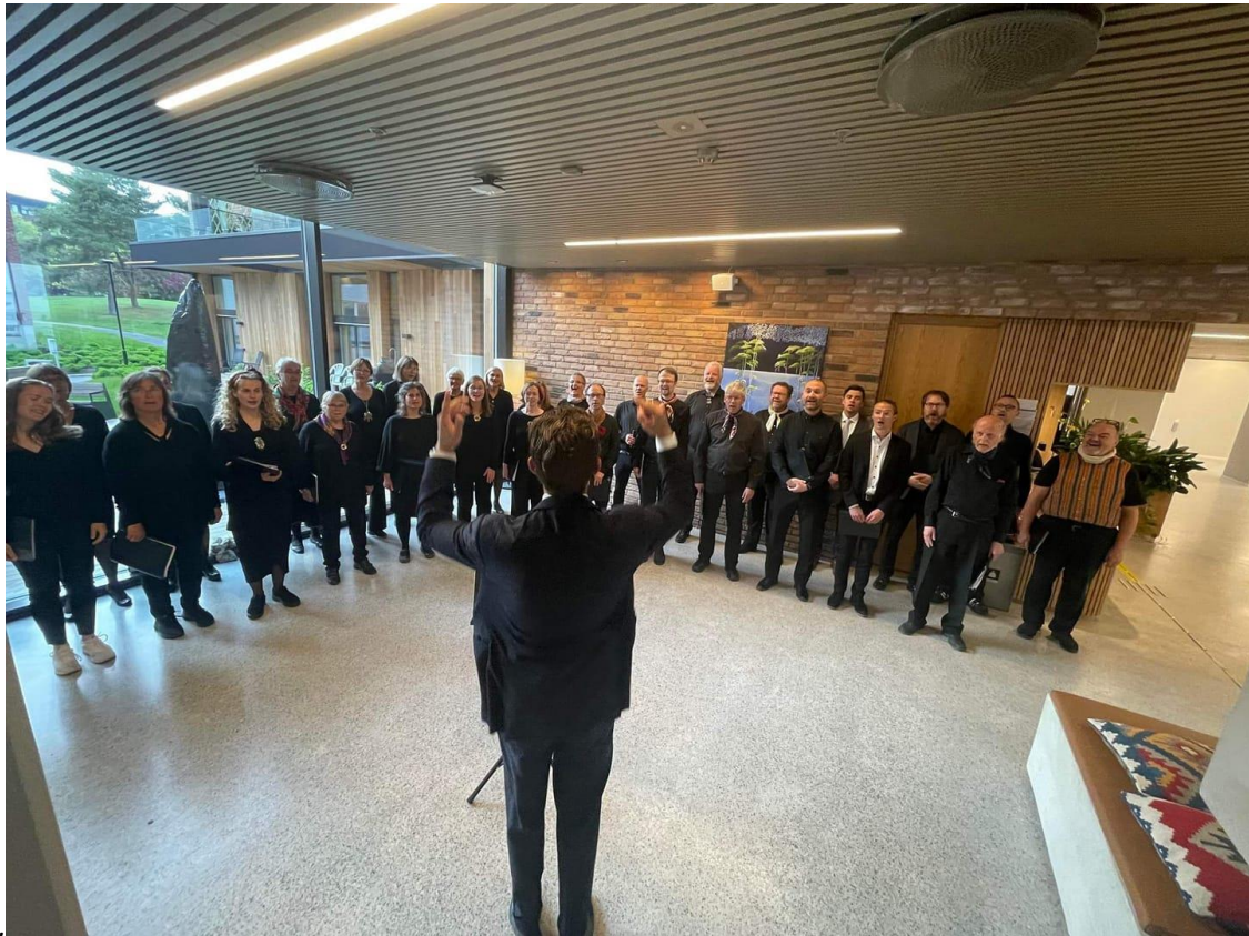
Syng for eldre. Konsert på Diakonveien omsorg+.