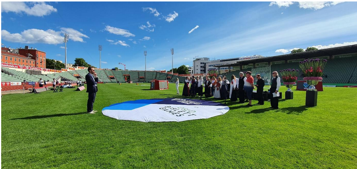
Øving av «Ja, vi elsker» (1. vers) på Bislett Games i Bislett stadion 16. juni 2022.