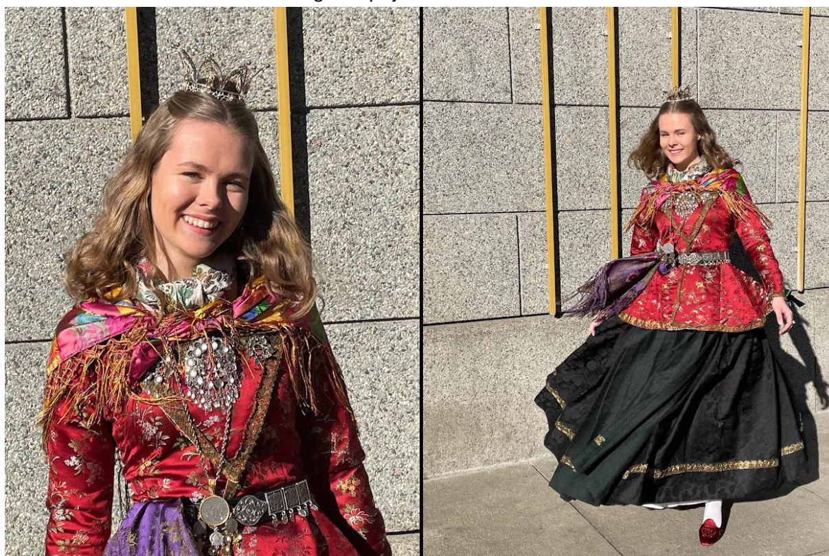
Klar for bryllaupsmesse i Glasmagasinet!