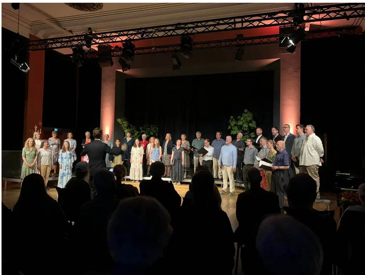
Sommarkonsert i Nynorskens hus 2. juni 2022.