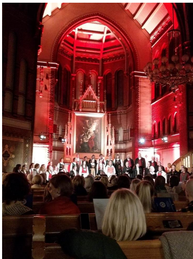
«Stille natt» Julekonsert i Sagene kyrkje 10. desember 2022.