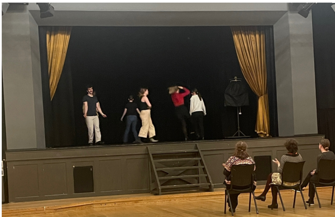
Illustrasjonsfoto frå 2024