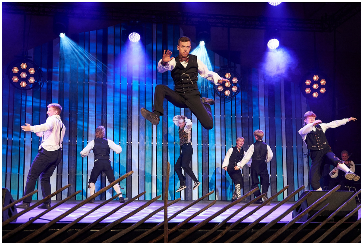
BULder og brak senior