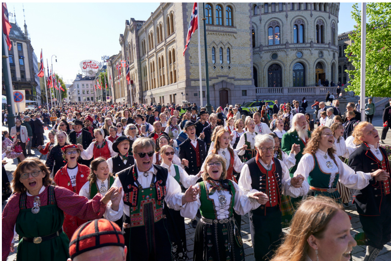
Flotte bunadar på Karl Johan, 17. mai 2023