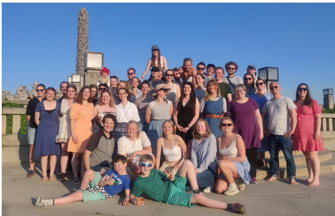
Gruppefoto frå sommarfesten 6. juni

Omlag halvparten har berre vore på éi øving, men samtidig har omlag 40 medlemmar vore på minst halvparten av øvingane. Så sjølv om det er stort gjennomtrekk føler me at me har ein god kjerne som kjem ofte.