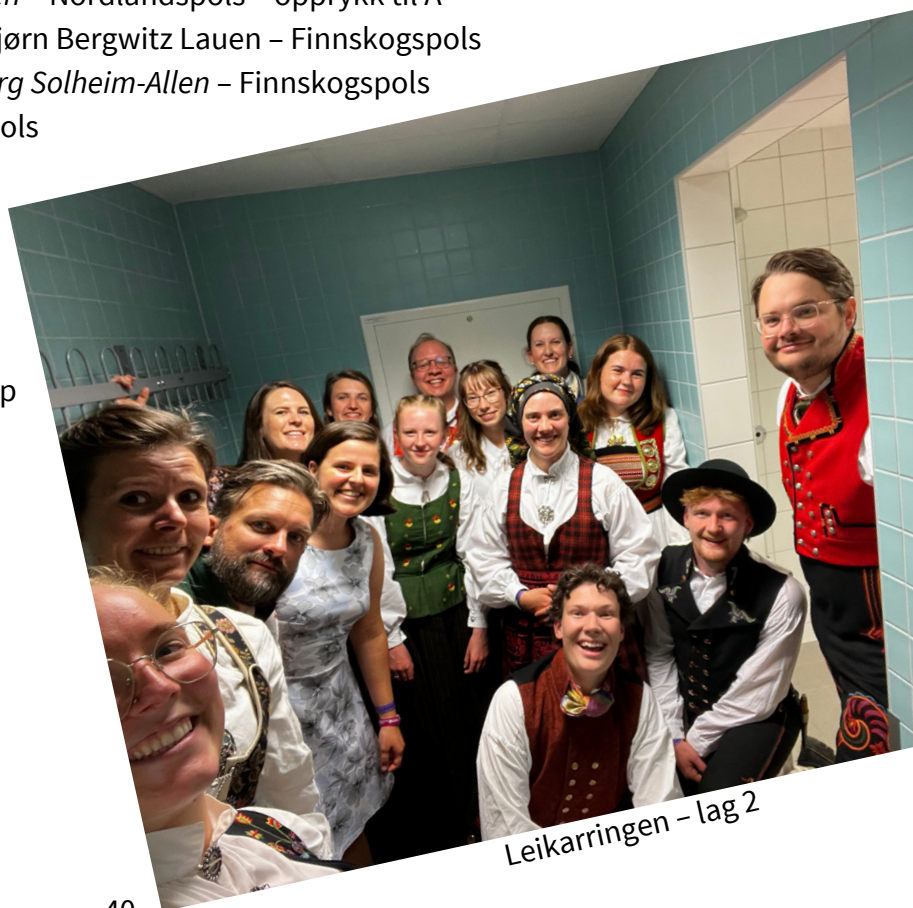
Leikarringen – lag 2