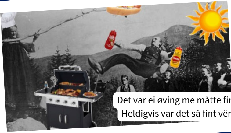
Det var ei øving me måtte finne alternativt lokale til Myretrill. Heldigvis var det så fint vær at det blei Myregrill i staden for.