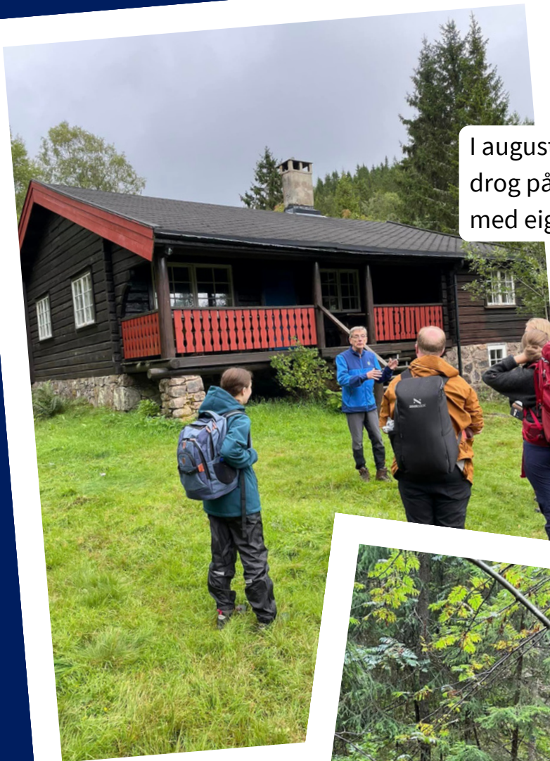
I august var det ein god gjeng som drog på hyttetur til Røkleiva, med eigen guide frå hyttestyret!