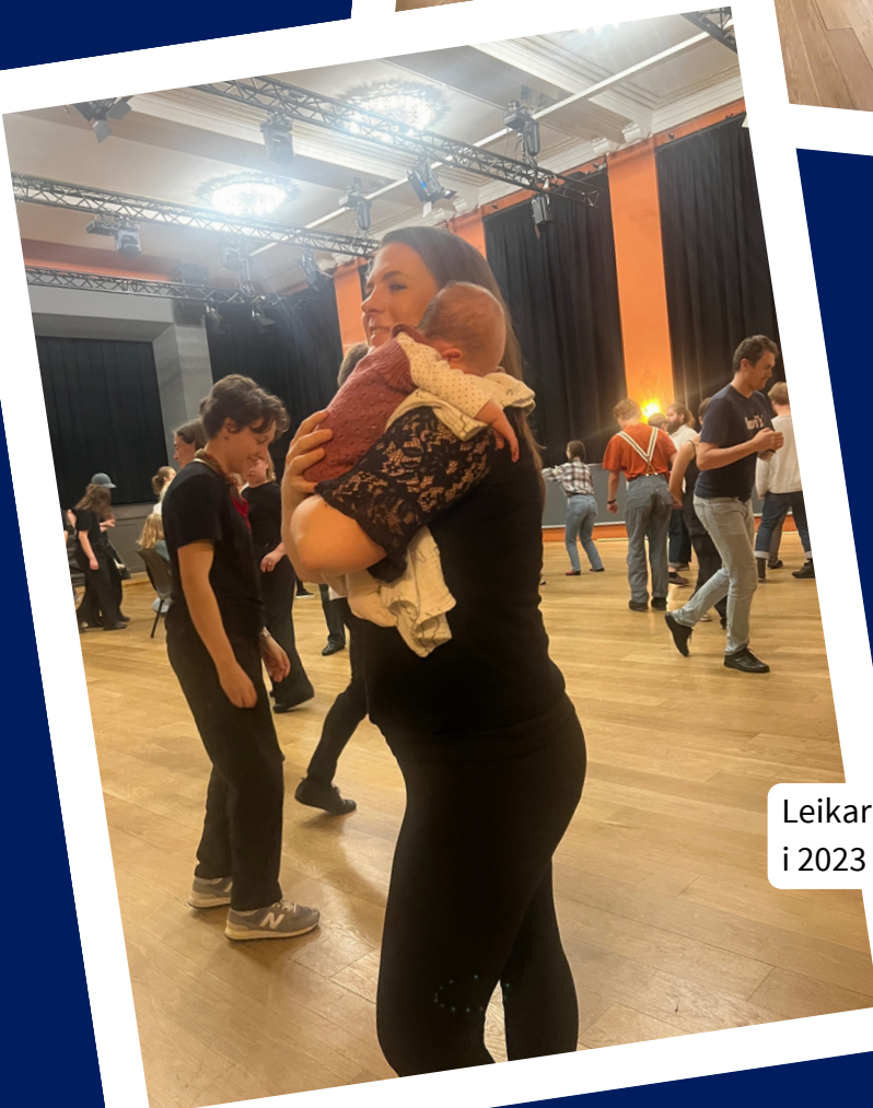
Leikarringens yngste medlem i 2023 på si første øving.