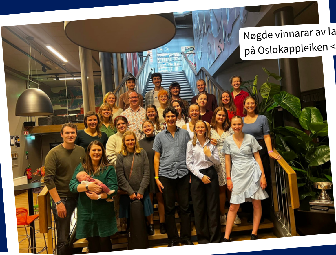
Nøgde vinnarar av lagdans senior på Oslokappleiken <3