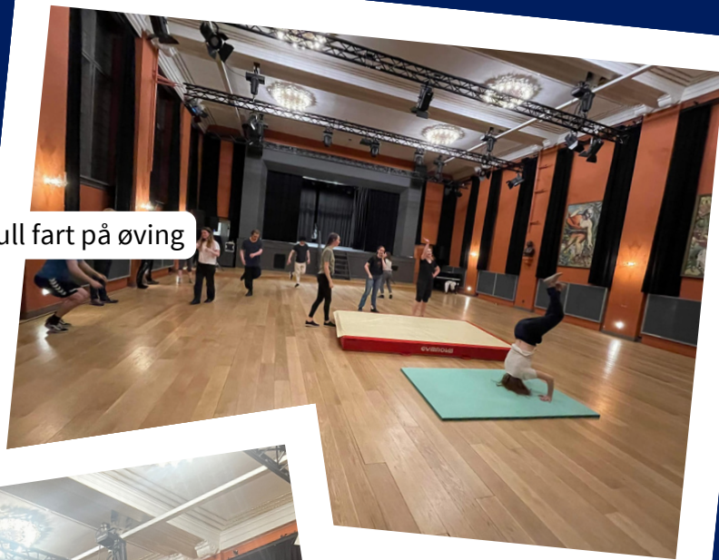
Myretrill i full fart på øving